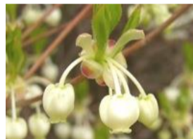
灯台躑躅(ドウダンツツジ)