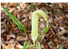
駿河天南星(スルガテンナンショウ)