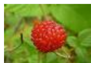
草莓(クサイチゴ)の実