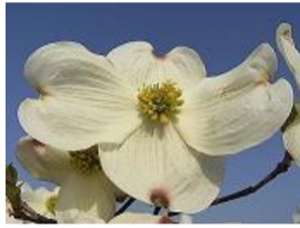
花水木(ハナミズキ)