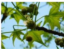
紅葉葉楓(モミジバフウ)