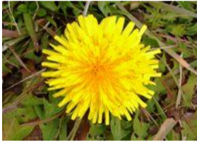
西洋蒲公英(セイヨウタンポポ)