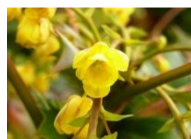
柗南天(ヘイラギナンテン)