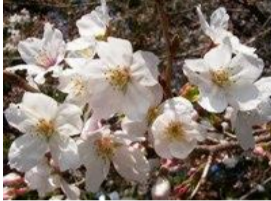
染井吉野(ソメイヨシノ)