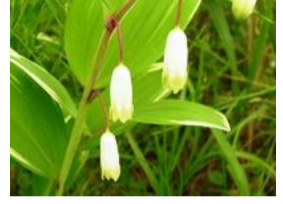
甘野老(アマドコロ)