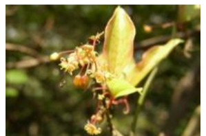
猿捕茨(サルトリイバラ)