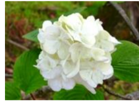
大手毬(オオデマリ)