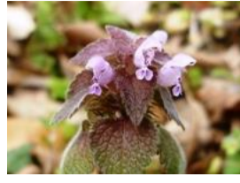
姫踊子草(ヒメオドリコソウ)