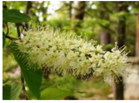
上溝桜(ウワミズザクラ)