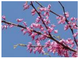
花蘇芳(ハナズオウ)