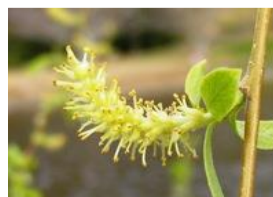
枝垂れ柳(シダレヤナギ)