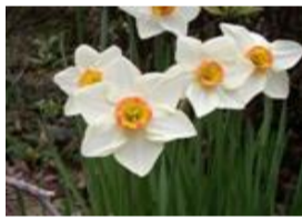
口紅水仙(クチベニスイセン)