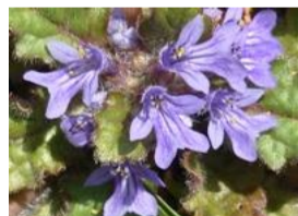
金瘡小草(キランソウ)