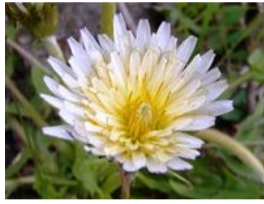
白花蒲公英(シロバナタンポポ)