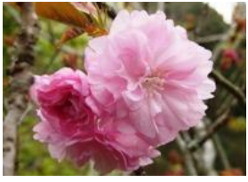
八重桜(ヤエザクラ)