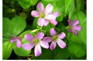
紫酢漿草(ムラサキカタバミ)