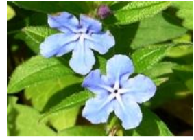
蜚葛(ホタルカズラ)