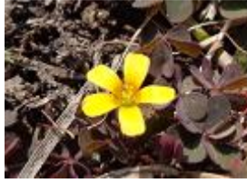
赤酢漿草(アカカタバミ)