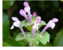
仏の座(ホトケノザ)