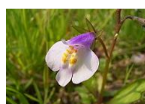
常盤黄檗(トキワハゼ)