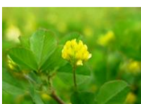
米粒詰草(コメツツメグサ)