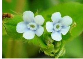
胡瓜草(キュウリグサ)