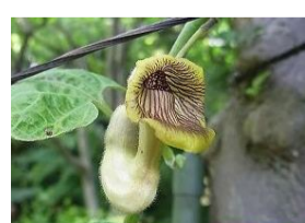
大葉馬の鈴草(オハウマノスズクサ)