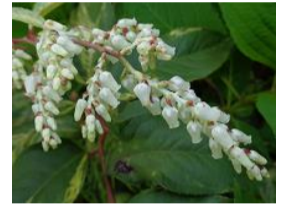
岩南天(イワナンテン)