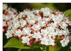
ピーナムティヌス