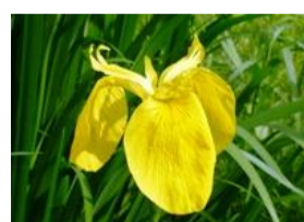
黄菖蒲(キシヨウブ)