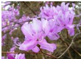
三葉躑躅(ミツバツツジ)