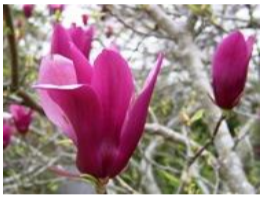
紫木蓮(シモクレン)