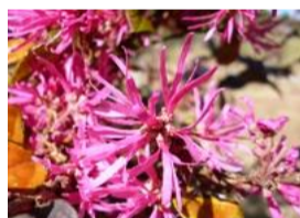
紅花常盤満作(ヘニハナキリマンサカ)