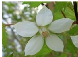
紅葉莓(モミジイチゴ)