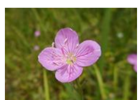
夕化粧(ユウゲショウ)