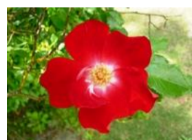
紅花照葉野薔薇(ベニバナテリハノバラ) 銀蘭(ギンラン)