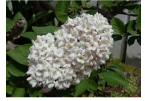
大丁字英莖(オチョウシガマズミ)