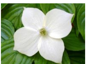
山法師(ヤマボウシ)