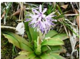
猩猩袴(ショウジョウパカマ)