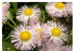
春紫苑(ハルジオン)