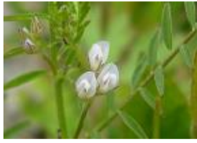
雀野豌豆(スズメノエンドウ)