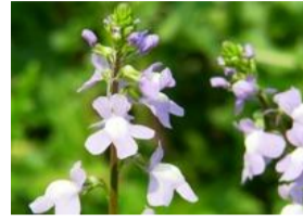
松葉海蘭(マツバウンラン)