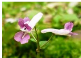
次郎坊延胡索(ジロボウエンゴサク)