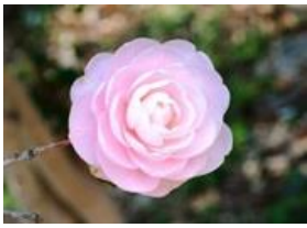
乙女椿(オトメツバキ)