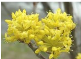
山菜萼(サンシュユ)