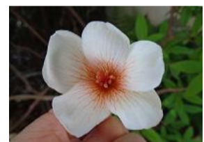
支那油桐(シナアブラギリ)