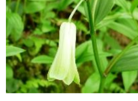
宝鐸草(ホウチャクソウ)