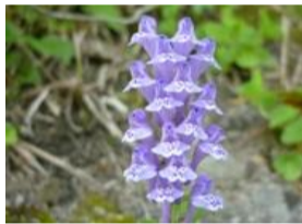
立浪草(タツナミノウ)