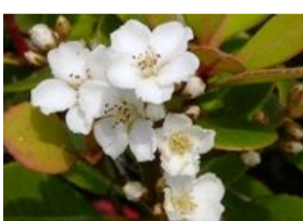
車輪梅(シャリンバイ)