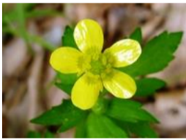
狐の牡丹(キツネノボタン)