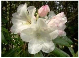
石楠花(シャクナゲ)