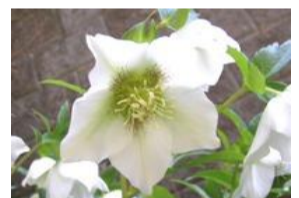
クリスマスローズ