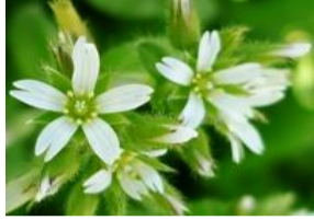
オランダ耳菜草(ミミナグサ)