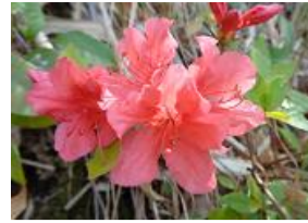
山躑躅(ヤマツツジ)