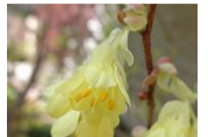
日向水木(ヒュウガミズキ)