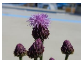
狐薊(キツネアザミ)