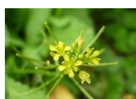
犬芥子(イヌガラシ)