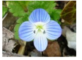
大犬(オオイヌ)のふぐり