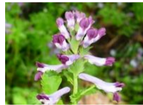
紫華鬘(ムラサキケマン)