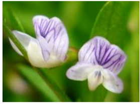
かす間草(カスマグサ)