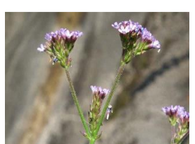
荒地花笠(アレチハナガサ)