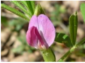
烏野豌豆(カラスノエンドウ)