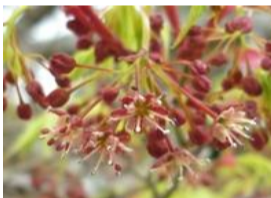
イロハ紅葉(モミジ)