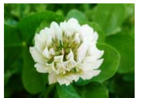
白詰草(シロツメグサ)