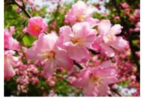
花海棠(ハナカイドウ)