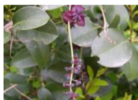
三葉木通(ミツバアケビ)