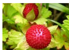
蛇莓(ヘビイチゴ)の実