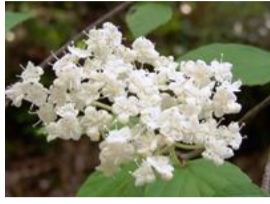
小葉蒲染(コハガマズミ)