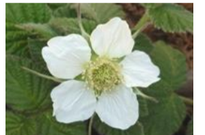
草莓(クサイイチゴ)