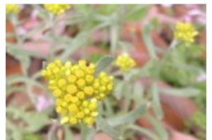
母子草(ハハコグサ)