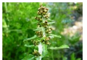
父子草擬(チチコグサモドキ)