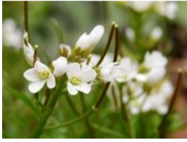
種漬花(タネツケバナ)