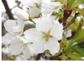
大島桜(オオシマザクラ)