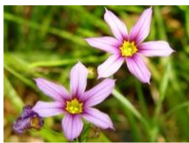
庭石菖(ニワゼキショウ)