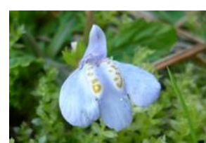
紫鷲苔(ムラサキサギゴケ)