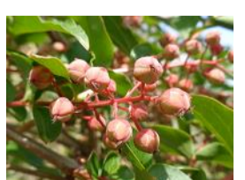
毒空木(ドクウツギ)の実