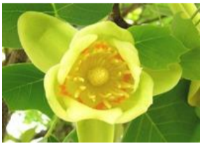
百合の木(ユリノキ)