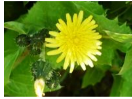
鬼野芥子(オニノゲシ)