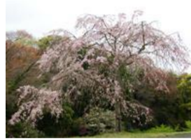
枝垂れ桜(シダレザクラ)