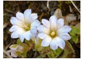
苔竜胆(コケリンドウ)