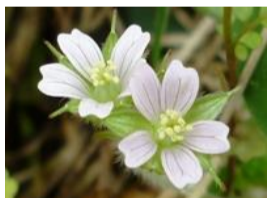
アメリカ風露(フロウ)