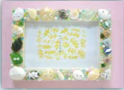
ビーチフォトスタンド (1,500円)

午後のはんびりと手づくり体験に挑戦をして世界にたった一つの作品作りに挑戦してみましょう！