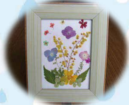
押し花を使ってアート作品を作ります (1,500)