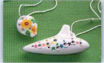
オカリナ絵付け (2,000円)