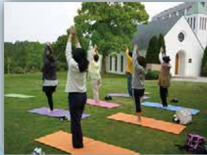
朝ヨガ (天候により開催場所が変わります)