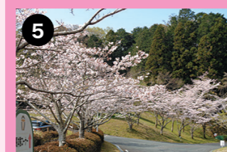
乗馬倶楽部トンネル近く 周遊道路から見る桜と馬の風景をお楽しみください