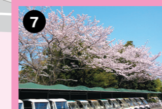
ホテルメインロビー周辺 ランドカー乗り場には綺麗な染井吉野が咲いています。