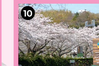
北正面ゲート周辺 見事な染井吉野がお迎えます