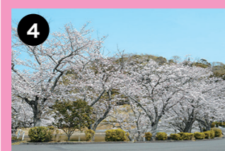
満水池周辺 水辺の桜のおすすめ写真スポット