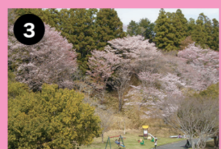
ちびっこ広場 すべり台などの遊具で遊びながら桜を楽しむことができます。