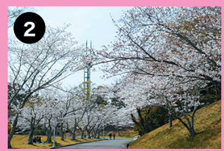
第1多目的広場周辺 桜のピンクと広場の緑のコントラストが素晴らしいスポットです