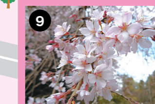
ビオトープ周辺 枝垂れ桜をお楽しみください