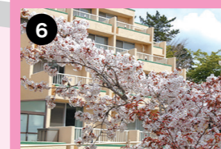
ホテルサウスウイング下 サウスウイング下には枝ぶりの良い山桜が咲き誇ります。