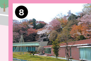
ミュージックガーデン周辺 見事な山桜をお楽しみください