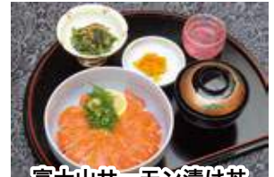
富士山サーモン漬け丼 1,800円(税込)