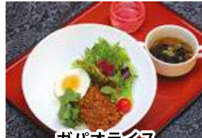
ガバオライス 1,430円(税込)