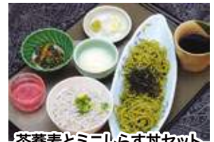
茶蕎麦とミニしらす丼セット 1,500円(税込)